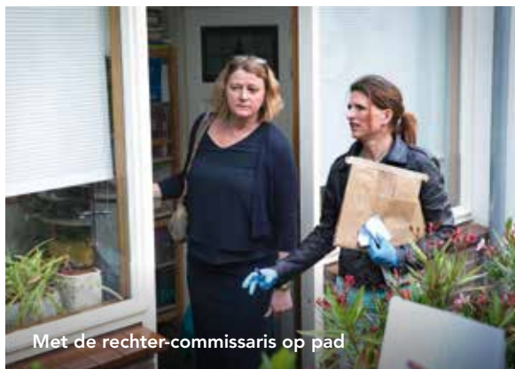
Met de rechter-commissaris op pad