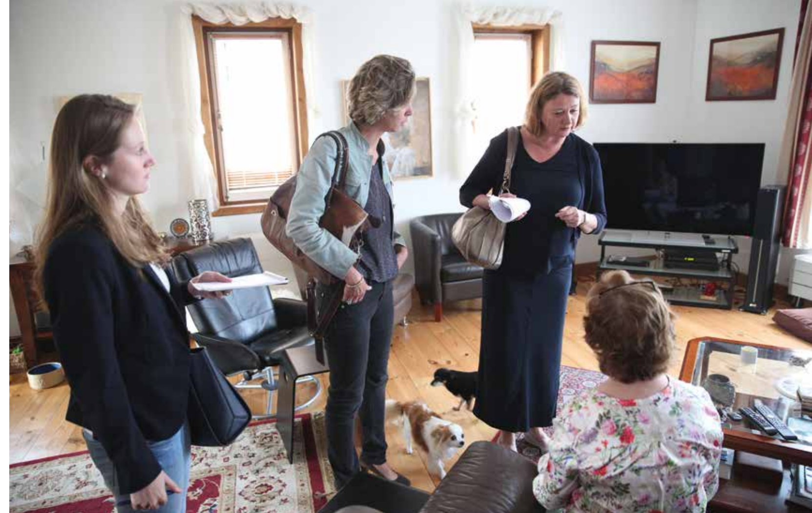
Tekst: Rien Aarts