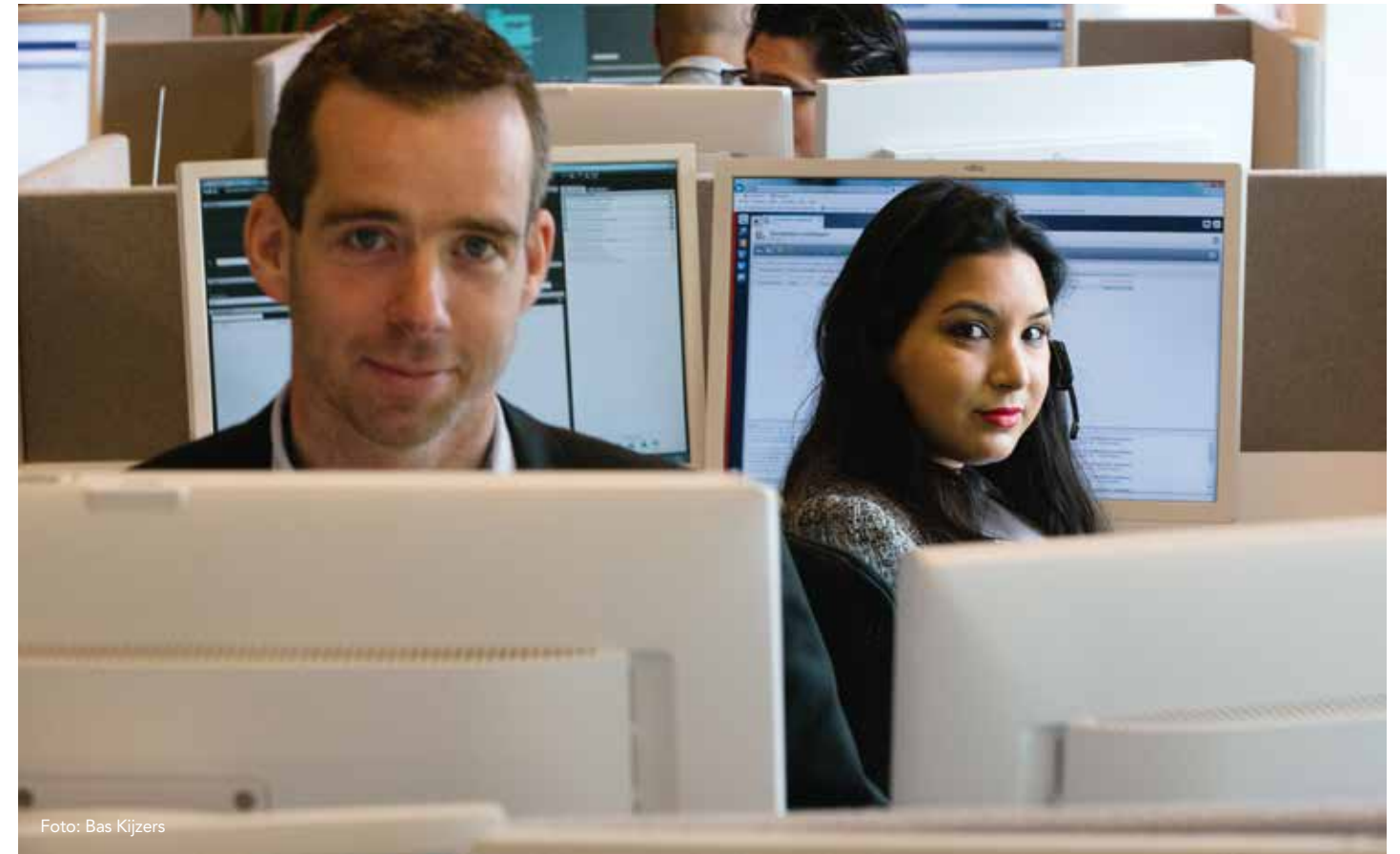
Medewerkers van het Rechtspraak Servicecentrum