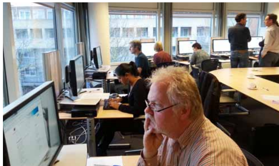
Burgerpanel denkt en kijkt mee.