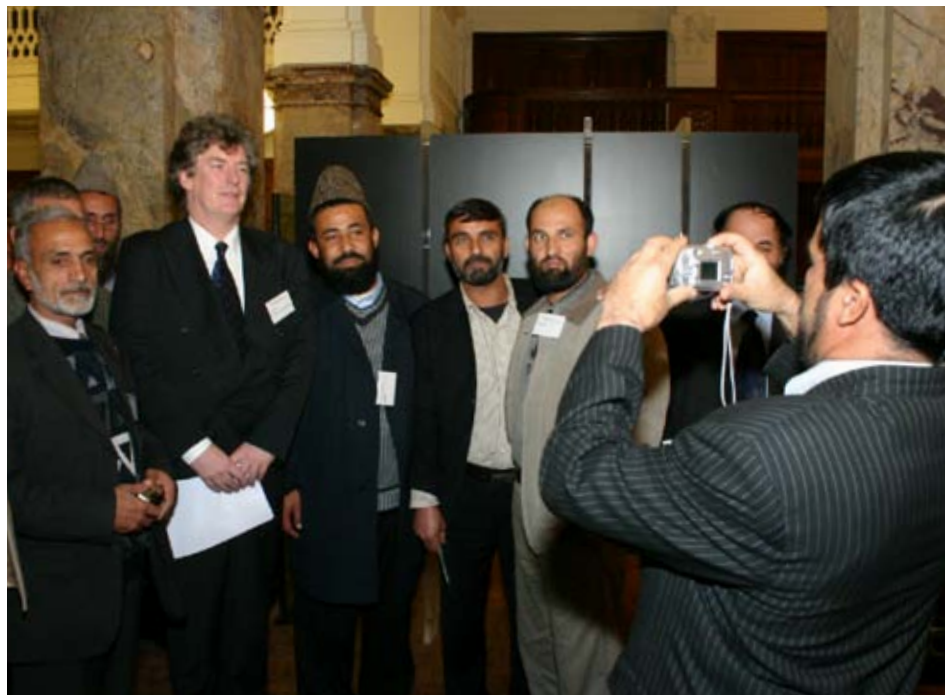
Een Afghaanse delegatie bezoekt Nederland