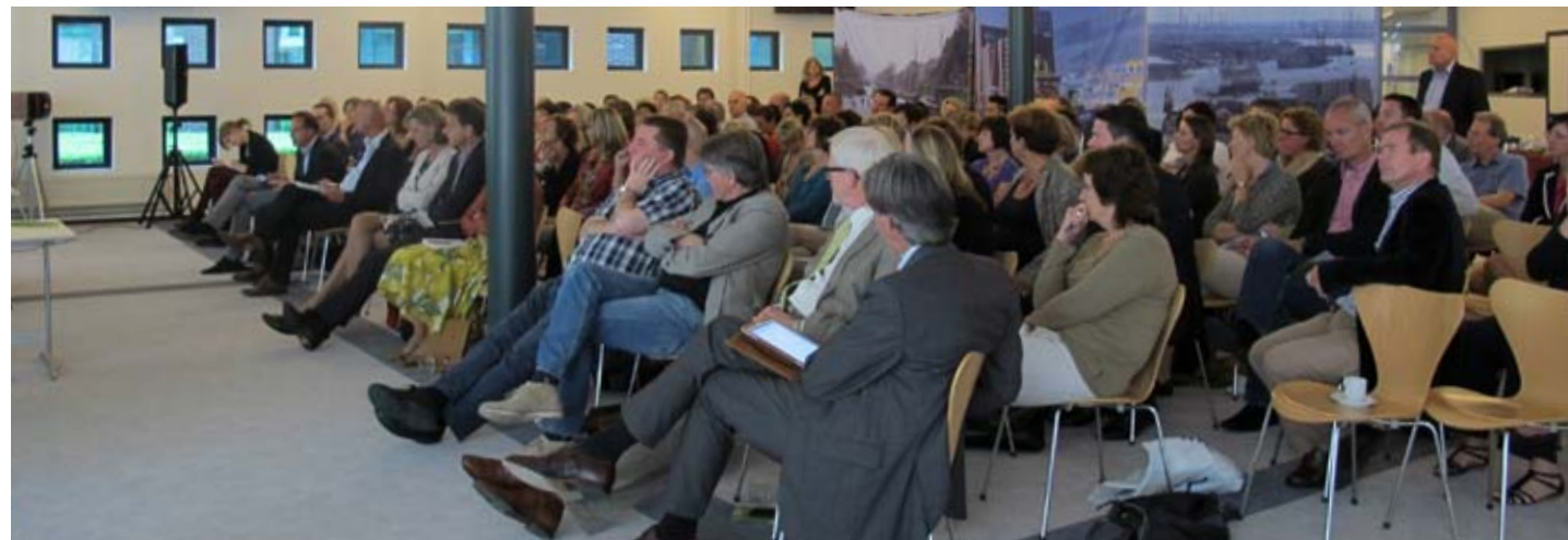
Personeel van de rechtbank Rotterdam wordt voorgelicht over het vernieuwingsprogramma

Tijdens deze eerste debatcafés is duidelijk naar voren gekomen dat vrijwel alle medewerkers vinden dat de Rechtspraak in het digitale tijdperk mee moet met haar tijd, en dat het best bizar is dat advocatenkantoren nog een fax hebben om met de gerechten te communiceren. Tegelijkertijd zien zij, net als het programmteam en de besturen van de gerechten, een enorme operatie op zich afkomen. Hun werk zal de komende jaren drastisch veranderen. Met trainingen, bijscholing en een goede inrichting van de werkplek zullen ze daarop worden voorbereid.