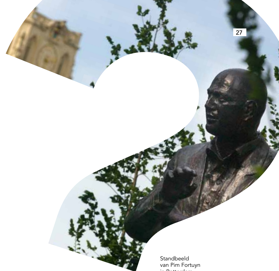
Standbeeld van Pim Fortuyn in Rotterdam.

Het Openbaar Ministerie is tegen deze uitspraak in beroep gegaan. Wanneer dat dient is nog niet bekend.